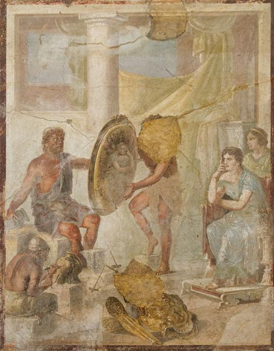
Ares und Aphrodite - Pompeji, Wandmalerei